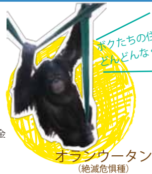
オランウータン (絶滅危惧種)

【旅行企画・実施】有限会社リボン 東京都知事登録旅行業第2-4850号 (社)全国旅行業協会会員 エコツーリズム・ネットワーク・ジャパン法人会員 〒160-0022 東京都新宿区新宿2-2-1 ビューシティ新宿御苑1203 旅行業務取扱管理者 峯崎健一郎