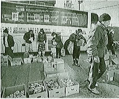
▶所在地 東京都新宿区新宿2 の2の1の1203 ▶電話番号 03・5363・9213