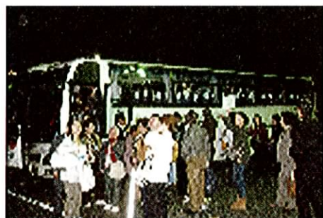
スカイツリーを見上げる参加者の方々