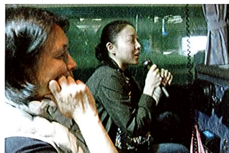
案内を聞きながら東京の街並みを見学

その後、再度乗車し、エコツーリズムのツアーの様子のDVDを見ながら、東京駅を経由し10数名が下車、それ以外の方は国技館前に到着後、解散となった。