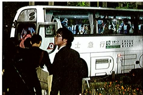
交流会終了後、両国国技館前からバスで出発