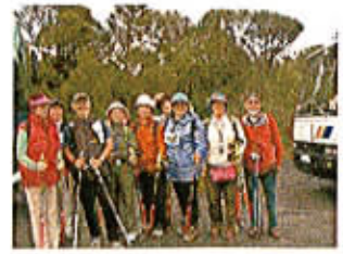
ニュージーランド・ワイポウアの森で