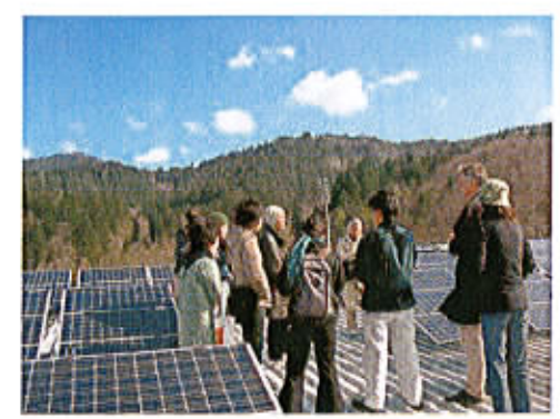
ドイツ、サッカー場・屋上ソーラーパネル