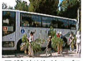
天ぶら油リサイクルバス