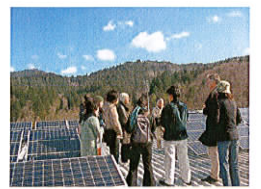
ドイツ、サッカー場・屋上ソーラーパネル