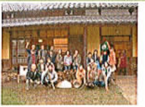
渡良瀬エコビレッジ

日時: 毎月第4土曜日 ★NPO エコツアーネットとの共催で実施します。 下線日はセミナー。随時詳細をHPやメールマガジンで紹介します。 1/24, 2/28, 3/28, 4/25, 5/23, 6/27, 7/25, 8/22, 9/26, 10/24, 11/28, 12/26 場所: 新宿発着で農山漁村を訪ね、第1次産業を体験し、春夏秋冬の地産地消を味わい、 オーガニックなライフスタイルを楽しみます。 費用: 随時設定 NPO エコツアーネット会員は会員証(カーボンオフパスポート)の割引特典を 利用できます(助成金などをいただき無料で実施する場合があります)