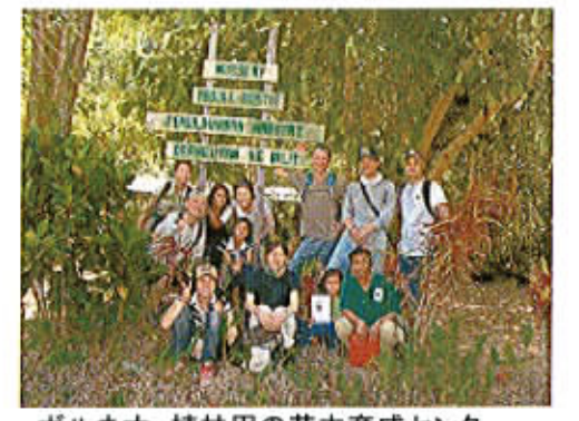
ボルネオ、植林用の苗木育成センター