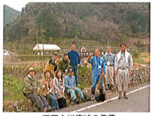
四万十川流域の集落