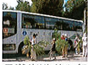
天ぶら油リサイクルバス