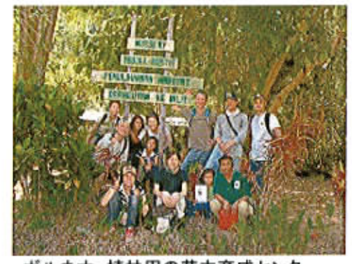
ボルネオ、植林用の苗木育成センター