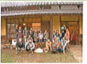
渡良瀬エコビレッジ

日時:毎月第4土曜日 ★NPO エコツアーネットとの共催で実施します。 下線日はセミナー。随時詳細をHP やメールマガジンで紹介します。 1/24, 2/28, 3/28, 4/25, 5/23, 6/27, 7/25, 8/22, 9/26, 10/24, 11/28, 12/26 場所:新宿発着で農山漁村を訪ね、第1次産業を体験し、春夏秋冬の地産地消を味わい、 オーガニックなライフスタイルを楽しみます。 費用:随時設定 NPO エコツアーネット会員は会員証(カーボンオフパスポート)の割引特典を 利用できます(助成金などをいただき無料で実施する場合があります)