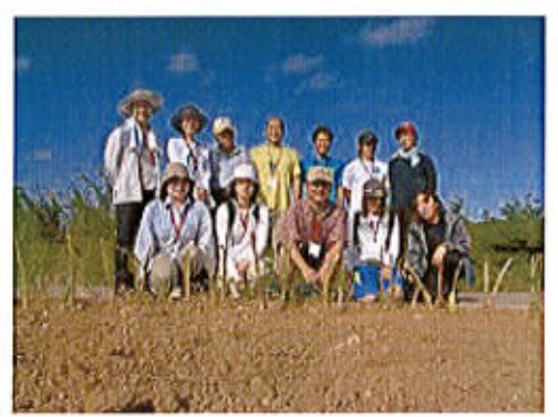
石垣島・白保での植樹