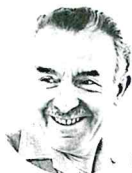
(セレスタン・フレネ)