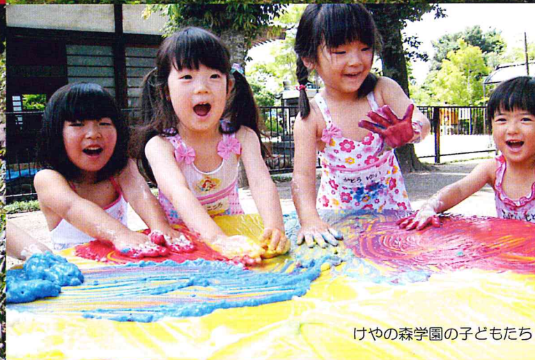
けやの森学園の子もたち