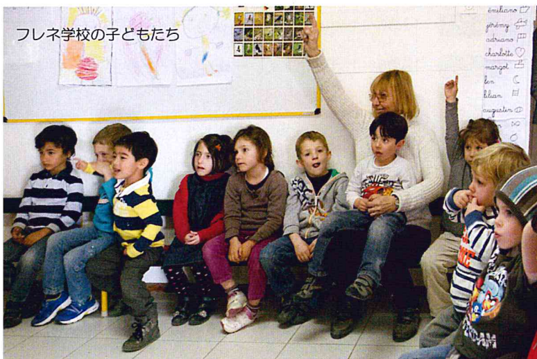
フレネ学校の子もたち